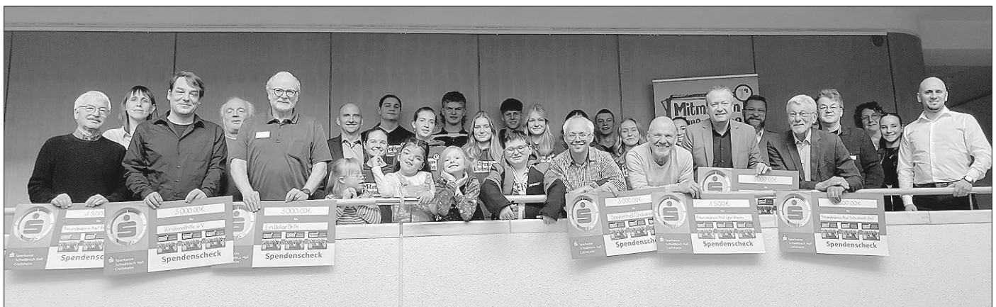
Die Botschafterinnen und Botschafter mit den Vertreterinnen und Vertretern der ausgewählten Spendenempfänger.

Damit ist „Mitmachen Ehrensache“ die größte regelmäßige Jugendbeteiligungsaktion im Bereich bürgerschaftlichen Engagements in Baden-Württemberg.