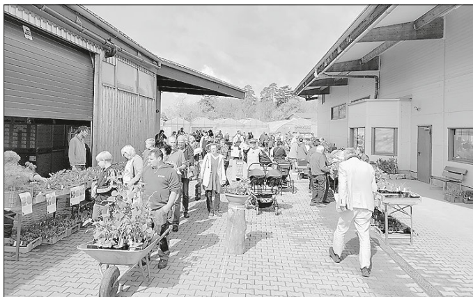
Der Pflanzenmarkt der Weckelweiler Gemeinschaften war sehr gut besucht.