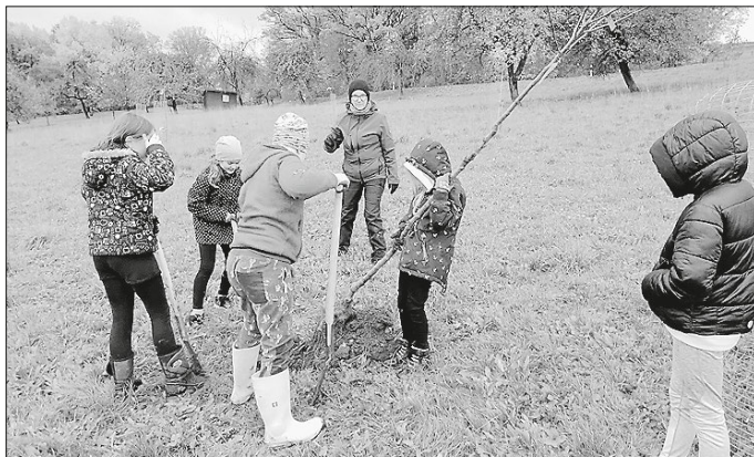
Mitglieder der NABU-Jugendgruppe beim Pflanzen von Obstbäumen

bauen, Apfelsaft pressen usw.) stehen auf dem Programm. In der Regel treffen wir uns vierzehntägig am Freitagnachmittag um 14.00 Uhr. Wenn Sie bzw. Ihr Kind Interesse an der Teilnahme haben, dann fordern Sie doch bitte das detaillierte Programm bei mir an (Email: NABU-Kirchberg@t-online.de ), Sie finden es aber auch auf unserer neu gestalteten Homepage ( www.nabu-kreissha.de/kirchberg ).