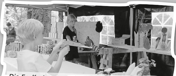
Die Fa. Kratzer organisierte zur Freude der kleinen Besucher eine mit viel Liebe zum Detail aufgebaute Spielstation.