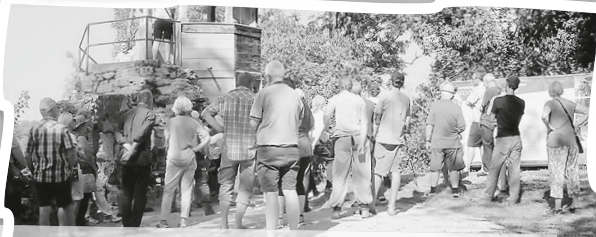
Die einzelnen Führungen waren sehr gut besucht.