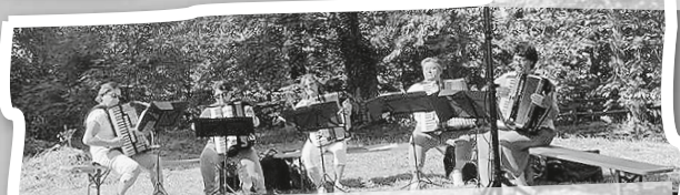
Das Akkordeon-Orchester Hohnerklang e. V. begleitete den ökumenischen Distriktgottesdienst.