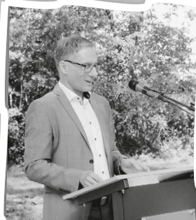
Bürgermeister Ohr eröffnet das Sophienberg-Fest.