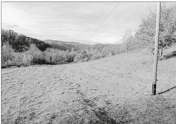
Der Trockenrasen in Mistlau

Anschließend gibt es Vesper für alle Helfer. Die Vereinsleitung