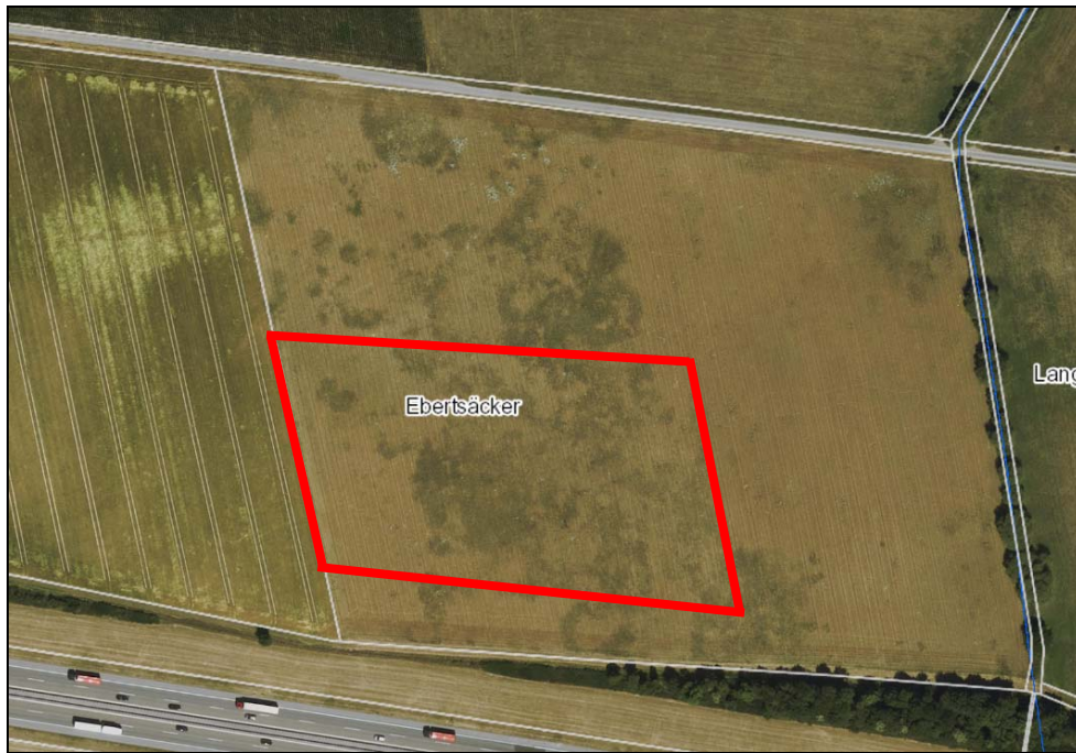
Abb.01: Plangebiet (rot) mit Luftbild (LUBW Online Kartendienst, unmaßstäblich)

Die Stadt Kirchberg/Jagst beabsichtigt im Ortsteil Herboldshausen die bauplanungsrechtlichen Voraussetzungen für die Errichtung einer Freiflächenphotovoltaikanlage mit ca. 1,37 ha Modulfläche entlang der südlich verlaufenden A6 zu schaffen.