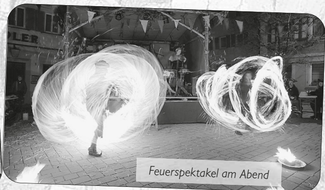
Feuerspektakel am Abend