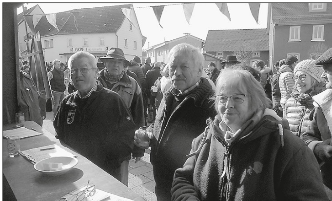
Die Mostprüfer bei der Arbeit

Am Samstag, 25. Februar 2023 , findet im Rahmen des Kirchberger Stadtfeiertages auf dem Frankenplatz unsere 35. Mostprämierung statt. Mostproben können ab 9.30 Uhr am NABU-Stand abgegeben werden (bitte in einer neutralen Mineralwasserflasche). Ab 10.30 Uhr verkosten vier sachkundige Mostprüfer die Mostproben und legen die ersten sechs Preisträger fest. Die ersten drei Preisträger erhalten je eine Urkunde und einen Obstbaumhochstamm, die Plätze vier bis sechs je ein Set Mosttrinkergläser. Die Preise werden gegen 12.30 Uhr verliehen. Außerdem bietet der NABU Kirchberg an seinem Stand gegrillte Bratwürste und Glühmost von der vereinseigenen Streuobstwiese an.