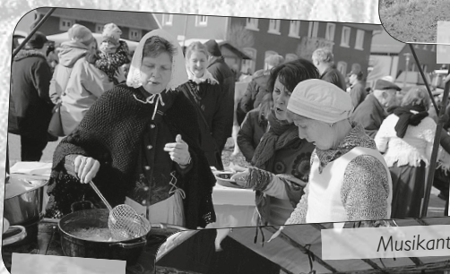
Leckerer von den Landfrauen