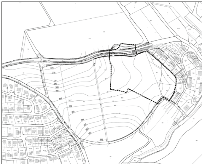
Abbildung: Lageplan mit Geltungsbereich „Oberloh I“

Für den räumlichen Geltungsbereich des Bebauungsplans und der örtlichen Bauvorschriften „Oberloh I“ ist der zeichnerische Teil zum Bebauungsplan des Büros Baldauf Architekten und Stadtplaner GmbH, Stuttgart maßgebend. Das Plangebiet hat eine Größe von ca. 3,2 ha und ist dem nachfolgend abgedruckten Lageplan mit Geltungsbereich zu entnehmen.