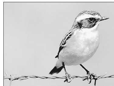
Der Vogel des Jahres 23, das Braunkehlchen