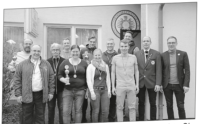
Ein Teil der erfolgreichen Mannschaften mit Bürgermeister Ohr

Bürgermeister Stefan Ohr nahm nach der Auswertung die Siegerehrung vor. Er bedankte sich beim Schützenverein für die Ausrichtung des Stadtfeiertagsschießens und bei allen, die auch 2023 wieder daran teilgenommen und damit die diesjährige Stadtfeiertagswoche eröffnet haben.