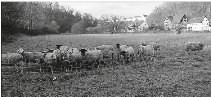
Schafe im Herbst auf der Lise-Weinmann-Wiese