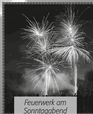
Feuerwerk am Sonntagabend