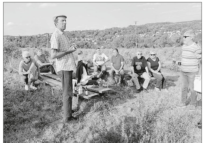
Der Betreiber des Rosenhofs erläutert den Kirchberger NABU Mitgliedern seine „Rosenphilosophie“

Der ausufernde Flächenfraß gefährdet Natur, Landwirtschaft und Lebensqualität. Unterstützen Sie den gemeinsamen Volksantrag mit Ihrer Unterschrift und setzen Sie ein Zeichen gegen ungezügelt Flächenverbrauch in Baden-Württemberg!