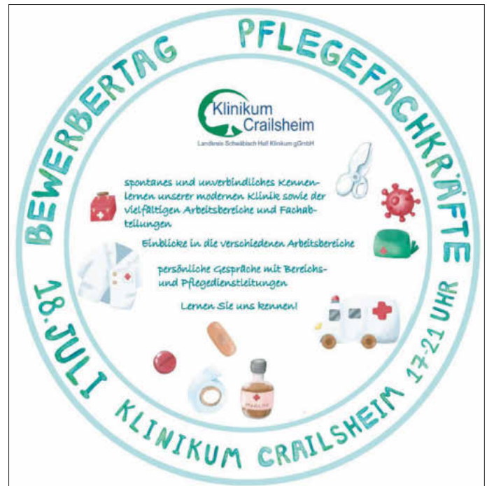
Einladung zum Bewerbungstag für Pflegekräfte.

Das Klinikum Crailsheim ist räumlich und medizintechnisch modern ausgestattet. Die Patienten werden von qualifizierten Ärztinnen und Ärzten und Pflegekräften bestmöglich versorgt. „Lernen Sie dieses Arbeitsumfeld und die Arbeitsbedingungen im Klinikum Crailsheim kennen. Kommen Sie ohne Voranmeldung vorbei, wir nehmen Sie an der Pforte des Klinikums in Empfang“, lädt Pflegedienstleiterin Ulrike Bolte ein.