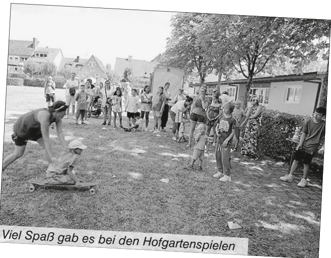
Viel Spaß gab es bei den Hofgartenspielen