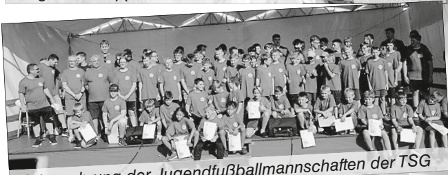
Meisterehrung der Jugendfußballmannschaften der TSG