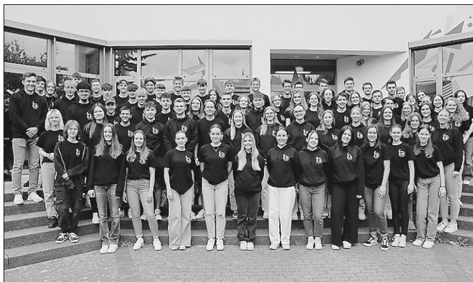
Die Abiturientinnen und Abiturienten in alphabetischer Reihenfolge: