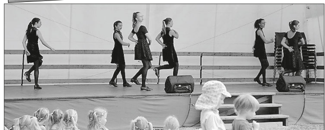
Die großen Steptänzer bei ihrem Auftritt