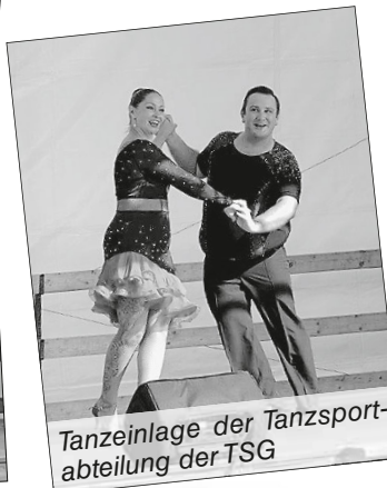
Tanzeinlage der Tanzsportabteilung der TSG