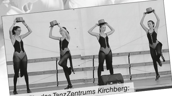
Auftritte des TanzZentrums Kirchberg:

Beim 34. Hofgartenfest vom 14.07. bis 16.07.2023 haben wieder viele fleißige Hände zum Gelingen beigetragen. Bei teilweise zu heißem Sommerwetter war das diesjährige Hofgartenfest wieder ein voller Erfolg.