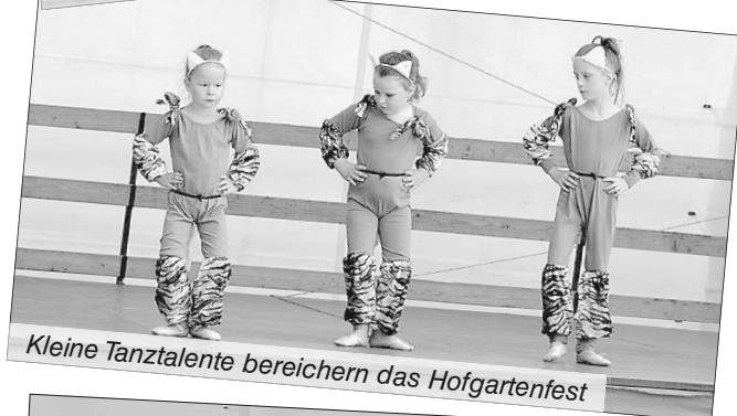
Kleine Tanztalente bereichern das Hofgartenfest

Außerdem geht unser Dank an alle Besucher.