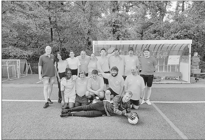
Die neuen Landesmeister aus Weckelweiler mit ihren beiden Coaches und dem Betreuer-Team in Stuttgart.