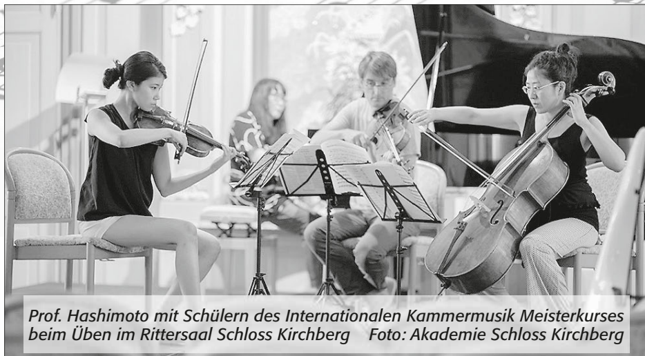
Prof. Hashimoto mit Schülern des Internationalen Kammermusik Meisterkurses beim Üben im Rittersaal Schloss Kirchberg

Der Eintritt zu allen Konzerten ist frei, um Spenden wird gebeten.