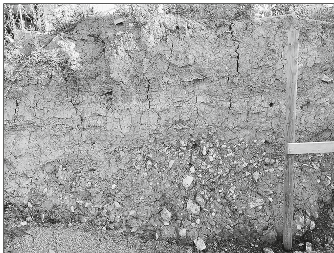
Bodenprofil, Baugrube, Im Stück, aufgenommen am 16. Juli 2023

Für die Arbeiten, die derzeit im Kirchberger Hofgarten zu sehen sind, wurden am 17. Juli 2023 Bodenproben „Im Stück“ und „Auf dem Sandbuck“ entnommen.