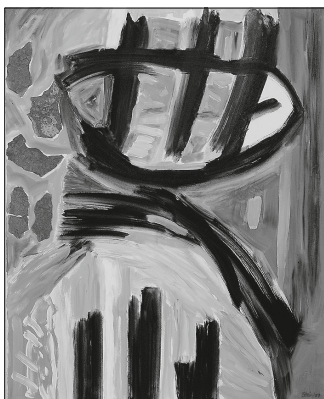
Gemälde Eberhard Stein.