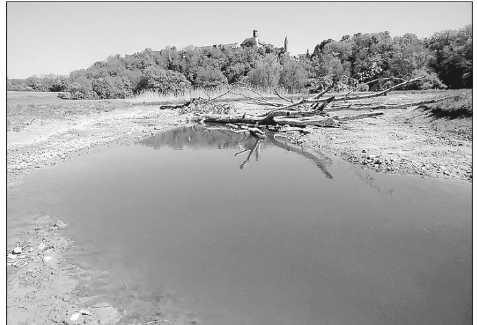
Das im Winter 2020 neu geschaffene Biotop bei Eichenau

in Zusammenarbeit mit dem RP Stuttgart und dem Fischereiverein Kirchberg auf einer 5000 m 2 großen Fläche eine Vorlandabsenkung durchgeführt, um die Uferstruktur der Jagst zu verbessern und um neue Laichmöglichkeiten zu schaffen. Zu dieser Führung treffen wir uns an der Obermühle in Eichenau. Die Bevölkerung ist zu dieser Veranstaltung recht herzlich eingeladen. Die Vereinsleitung