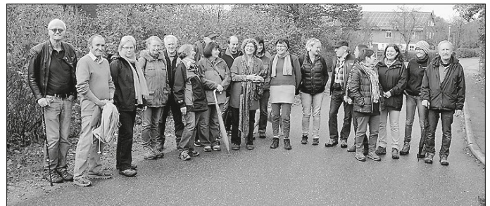
Helferinnen-Ausflug nach Kleinallmerspann im Oktober 2014.

Unser Helfer*innen-Ausflug nach Mistlau findet am 28. Oktober 2023 statt. Genauerer teilen wir euch/Ihnen noch rechtzeitig mit.