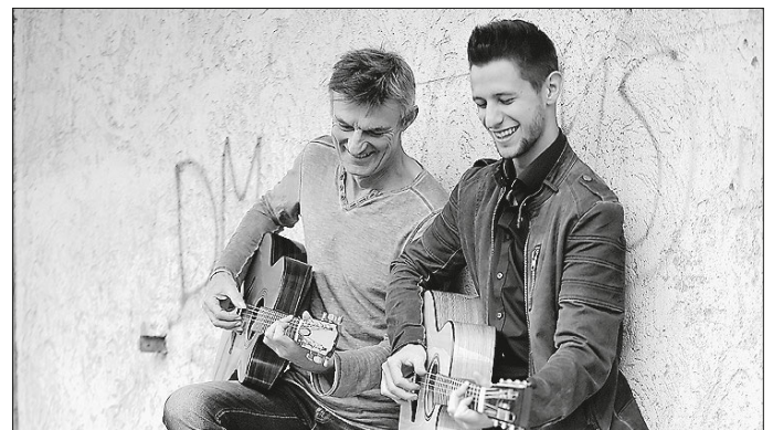
Das Duo Tirando ist Gast bei den Weckelweiler Gemeinschaften.

Der Eintritt beträgt 12 Euro, ermäßigt 8 Euro. Die Kulturscheune ist in der Heimstraße 6 in Weckelweiler (Kirchberg/Jagst) zu finden. Kontakt: Telefon 07954 970-150