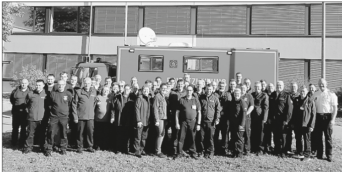
Teilnehmerinnen und Teilnehmer am Übungswochenende der Technischen Einsatzleitung (Führungsstab) des Landkreises in Karlsruhe.

Zuletzt war der Führungsstab 2016 bei der Überflutung von Braunsbach und 2022 bei der Ankunft der ersten Ukraine-Flüchtlinge im Landkreis Schwäbisch Hall im Einsatz.