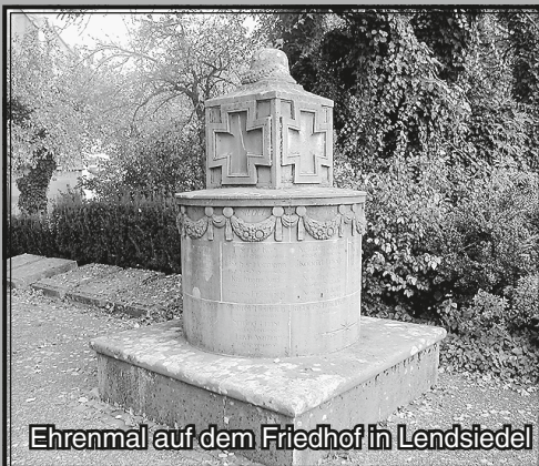
Ehrenmal auf dem Friedhof in Lendsiedel