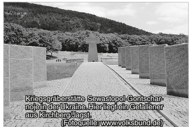
Kriegsgräberstätte Sewastopol-Gontscharnoje in der Ukraine. Hier liegt ein Gefallener aus Kirchberg/Jagst.