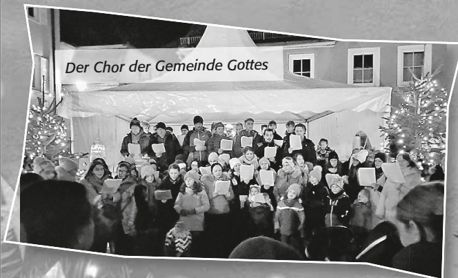
Der Chor der Gemeinde Gottes