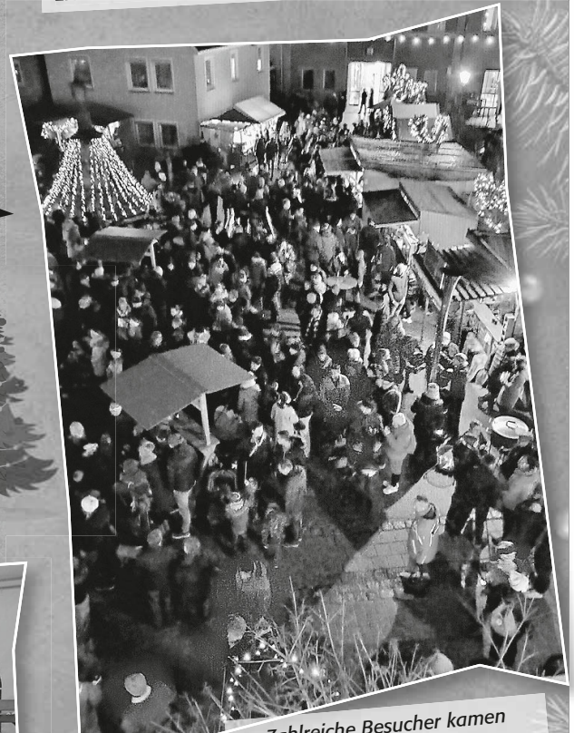
Zahlreiche Besucher kamen nach Kirchberg

Die Stadt Kirchberg bedankt sich bei allen Beteiligten und Helfern, die wieder zum Gelingen des Weihnachtsmarktes beigetragen haben. Zudem dankt die Stadt den Anwohnern im Städtle für ihr Verständnis.