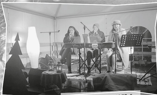
Die Band „MORE or LLESS“.