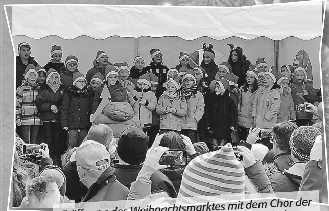
Eröffnung des Weihnachtsmarktes mit dem Chor der Erstklässler der August-Ludwig-Schlözer-Schule

Trotz wechselhaftem Wetter kamen dieses Jahr wieder zahlreiche Besucher aus nah und fern am vergangenen Wochenende zum Kirchberger Weihnachtsmarkt. Die Erstklässler der August-Ludwig-Schlözer-Schule stimmten mit einem tollen Beitrag zur Eröffnung auf Weihnachten ein. Christkind und Nikolaus besuchten am Samstag und Sonntag die kleinen Gäste. Zahlreiche Stände lockten zu Weihnachtseinkäufen und auch für Essen und Trinken war reichlich gesorgt. Für Adventsstimmung sorgten u. a. das Bläserensemble der Kirchberger Blaskapelle auf der Stadtmauer, das Platzkonzert der Blaskapelle und die Auftritte des Chors der Gemeinde Gottes sowie das Adventskonzert in der Stadtkirche. Für gute Stimmung sorgte bereits am Freitagabend die Band „MLJI“ und am Samstagabend die Band „MORE or LLESS“.