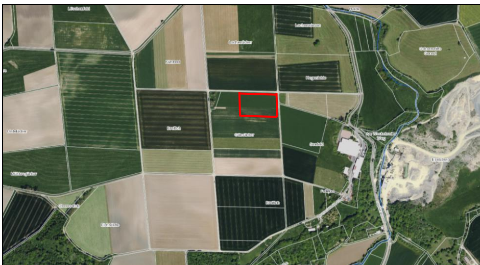
Abb.01: Lage des Vorhabenbereichs (rot) im Raum

Das Plangebiet setzt sich vollständig aus einem intensiv genutzten Acker ohne nennenswerte Ackerrandstreifen zusammen und befindet sich im nordöstlichen Teilbereich einer ausgedehnten (ca. 2,4 km 2 ) und ebenen Agrarlandschaft. Der Acker teilt sich in einen nördlichen Abschnitt mit Saatkleemischung und einen südlichen Abschnitt mit Maisbestellung auf.