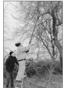
Baumpflegerie auf der NABU-Streuobstwiese.

Am Samstag, 11. Januar , treffen wir uns um 10.00 Uhr an der NABU Streuobstwiese an der Kuhsteige, um die Nachpflege vorzunehmen. Schlehen und Bäume müssen geschnitten werden, Nistkästen werden gesäubert, und das, was die Schafe bei der Beweidung verschmäht haben, muss nachgemäht werden. Also bitte Astschere, Baumsäge, Heugabel, eventuell Motorsense und/oder Balkenmäher mitbringen.