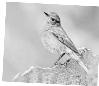
Ein Hausrotschwanzweibchen.

Als ursprüngliche Felsbrüter nutzen die Vögel in Städten und Dörfern gerne Neststandorte an Gebäuden