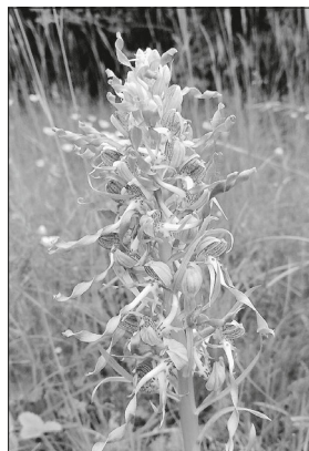
Bocks-Riemenzunge am Trockenrasen in Mistlau